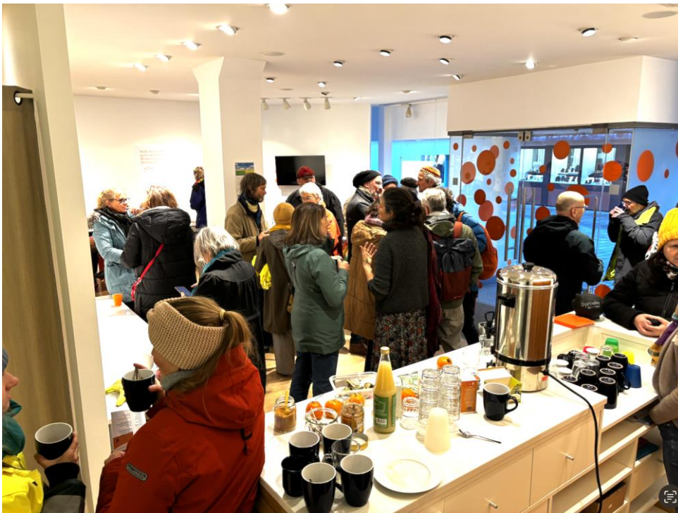
Demokratiekundgebung am 20.01.2024