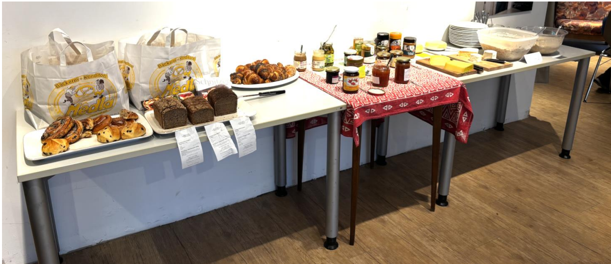
28.09.2024: Faires Frühstück im Welthaus