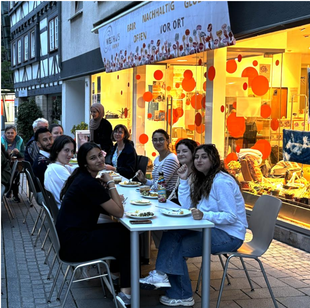
12.06.2024: Internationale Studierende kochen im Welthaus