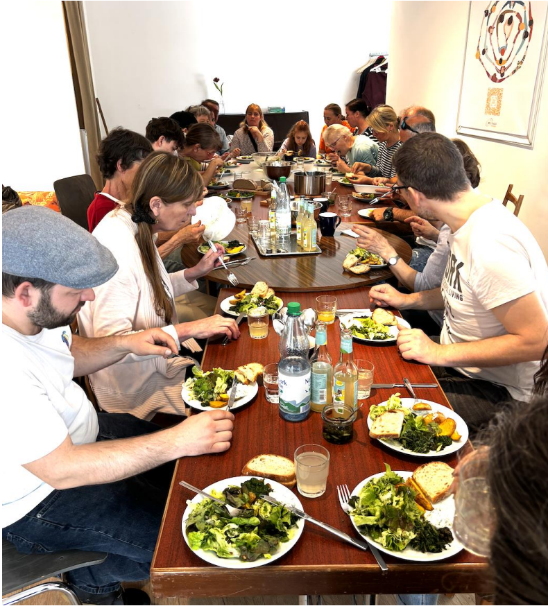
Wildkräuterwanderung mit Verkostung am 06.04.2024