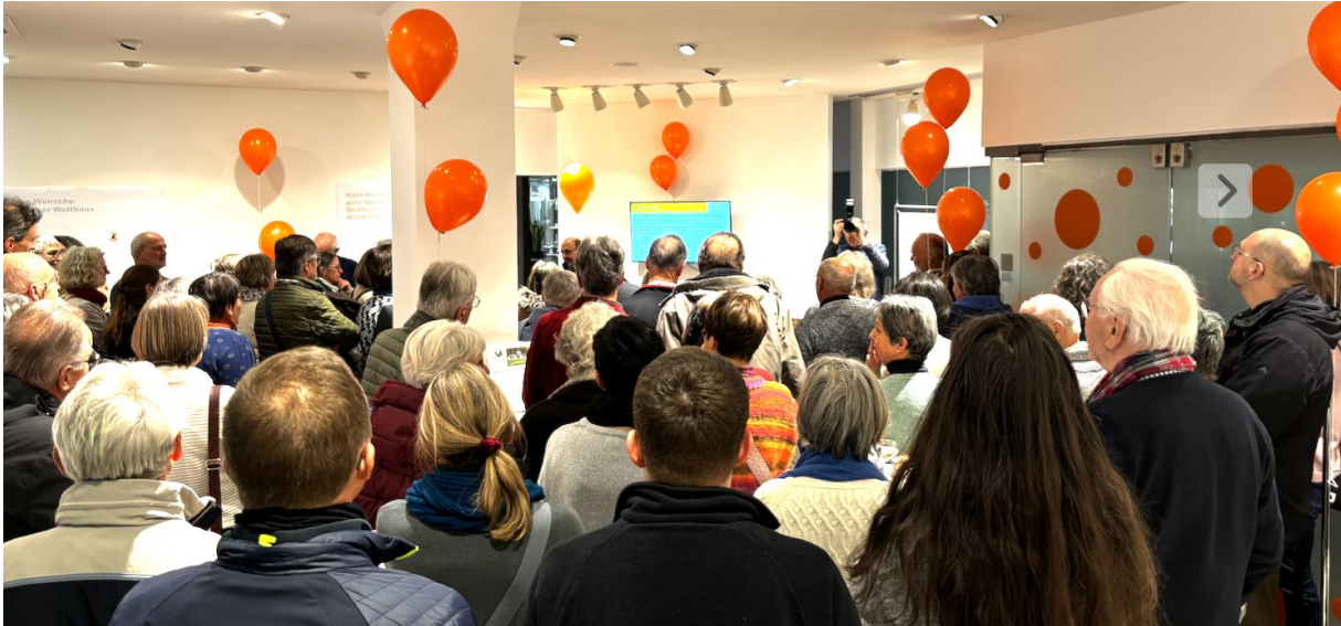
Start der Zwischennutzung im Januar 2024

Nachfolgend einige Impressionen der Zwischennutzung: