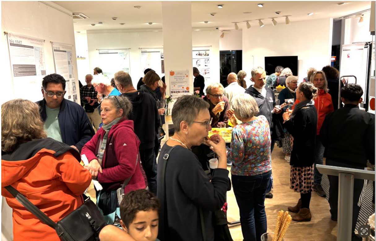
19.10.2024: Ausstellungseröffnung „Den Schmerz der Anderen begreifen“.